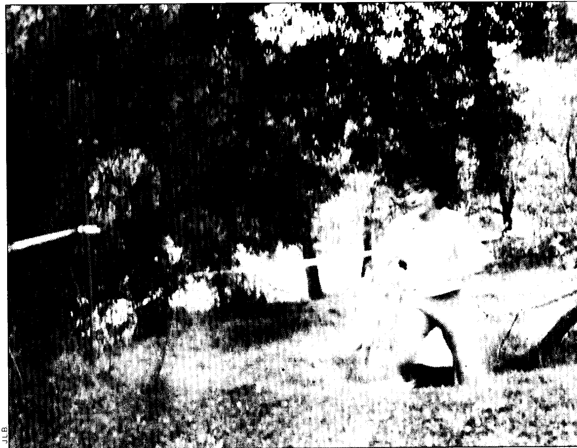
La prueba resultó bastante dura para los jóvenes atletas.

Alevín fem.- 1. Cari Naya (San Vicente); 2. Leire López (San