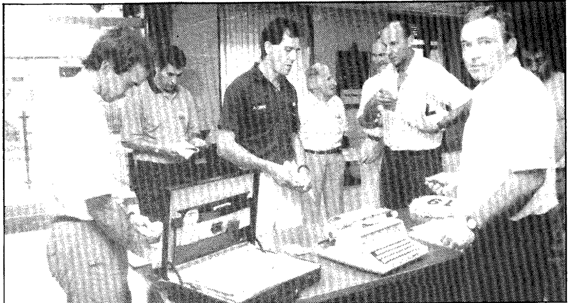
Los directores deportivos en el momento de inscribir a sus equipos ayer por la tarde en Huesca

A partir de las 10 de la mañana, media hora antes se abrirá el control de firmas, tiene prevista la salida, desde la plaza de Navarra la XXII Clásica Zaragoza-Sabiñánigo. La carrera será neutralizada hasta el puente de San Miguel donde se dará la salida oficial. Yéqueda, Nuño, Arguis, túnel de la Manzanera (neutralización), Alto de Monrepós (Premio Montaña), cruce de Boltaña, Lanave, Hostal de Ipiés,